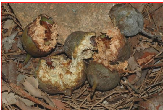
Nozes de Marri, mastigadas por Cacatuas