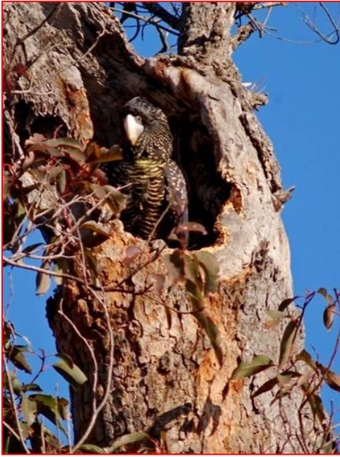
등지에 암컷 빨간꼬리검은코카투