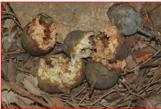
Noci di Marri mangiate dal cacatua nero coda-rossa della foresta