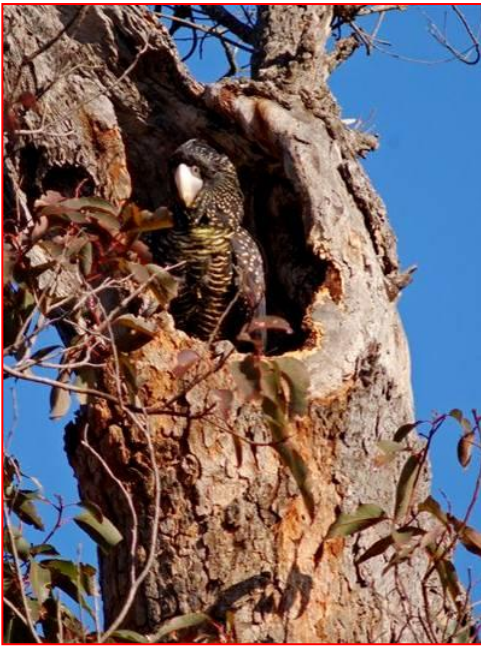
Femmina di cacatua nero coda-rossa della foresta nel nido