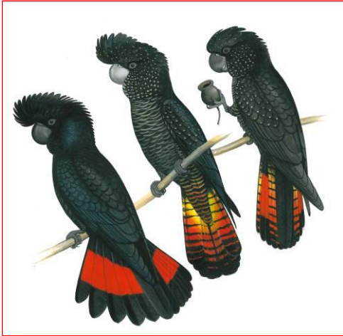
Männchen (links), Weibchen (Mitte), Jungtier (rechts)