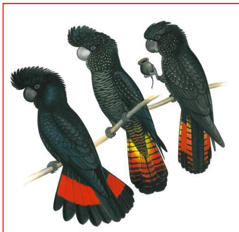
雄(左), 雌(中), 幼鸟(右)