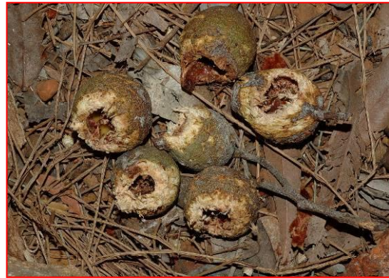
ニシオジロクロオウムが食べたマリーの実