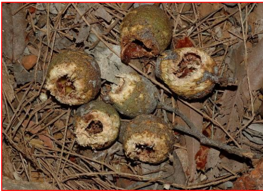
Kakatua Carnaby sedang memakan biji Marri