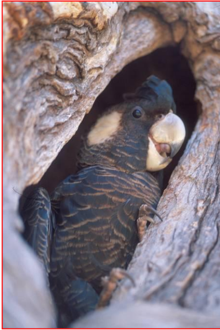
Betina Kakatua Carnaby di dalam sarang