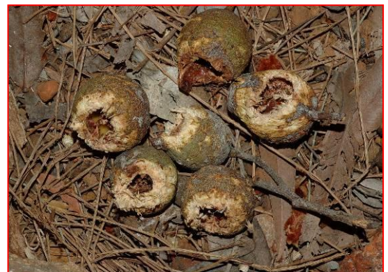
Marrinüsse mit Fraßspuren von Carnabys Weißohr-Rabenkakadu

Übersetzung aus den Englischen: Volker F.