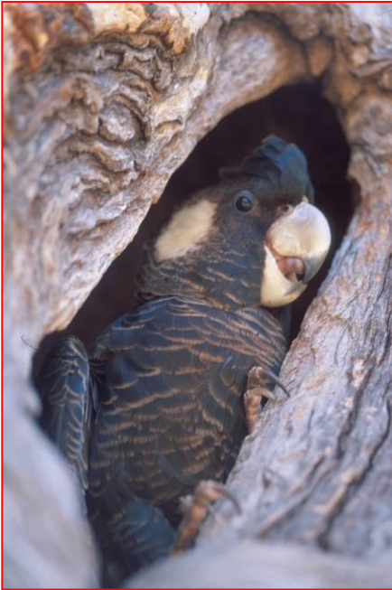
Weibchen des Carnabys Weißohr-Rabenkakadus am Nest