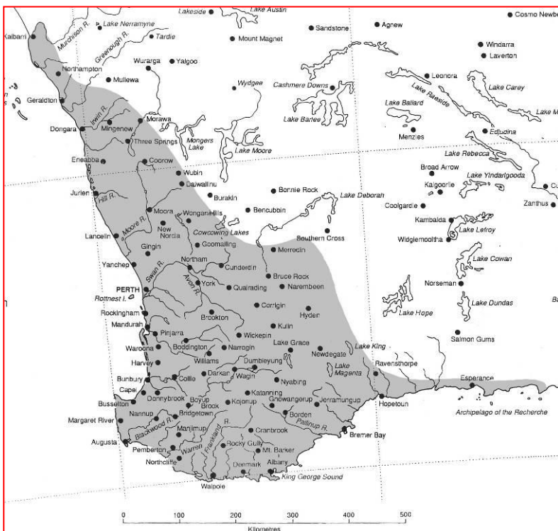
Derzeitiges Verbreitungsgebiet in südwest Westaustralien.