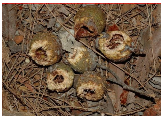
Les noix de Marri grignottées par le Cacatoès de Carnaby