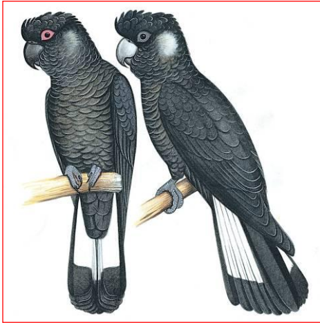
Mâle (gauche), Femelle (droite)