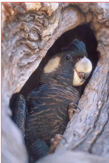
Cacatoès de Carnaby femelle dans le nid