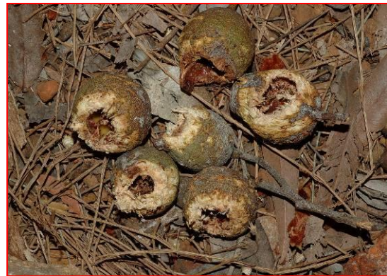
被鳳頭鸚鵡咀嚼過的 Marri 堅果