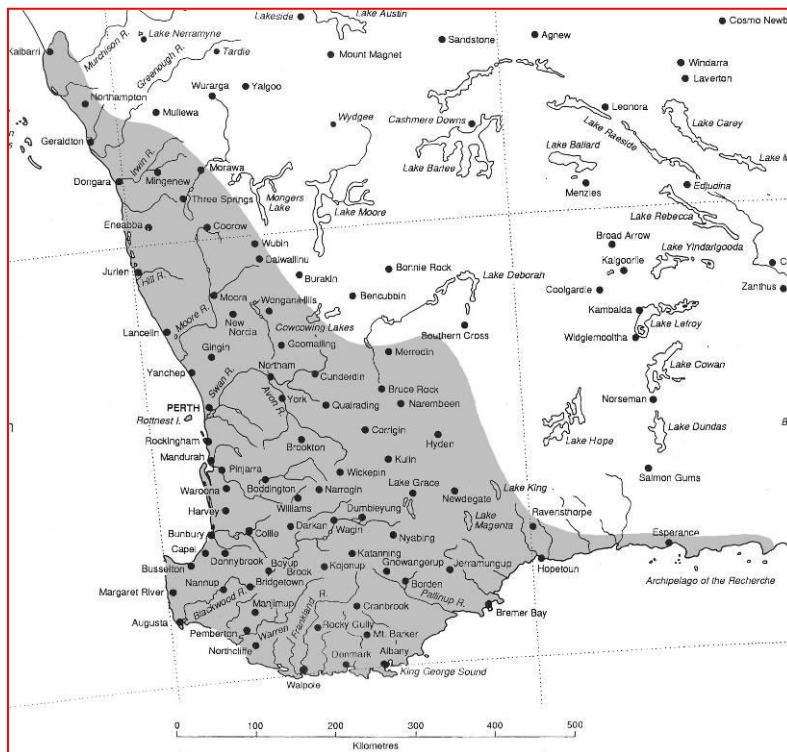
在西澳西南地区的现有分布