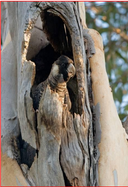
Femmina di cacatua di Baudin nel nido