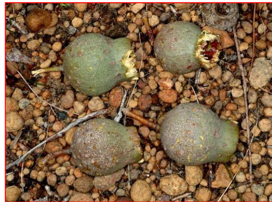
Noci di Marri mangiate dal Cacatua di Baudin

Impaginazione: Kim Sarti Traduzione: Alessandra Giacchi