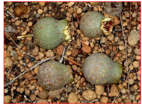
Les noix de Marri grignotés par le Cacatoès de Baudin