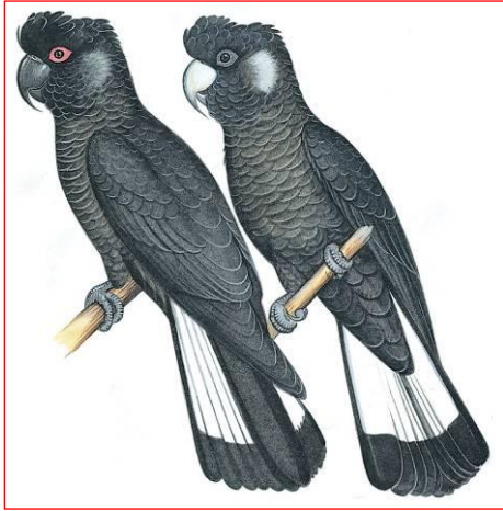
Mâle (gauche), Femelle (droite)