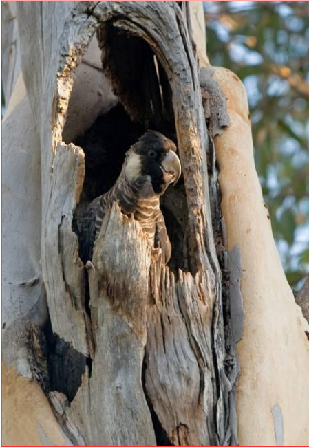
Cacatoès de Baudin femelle dans le nid