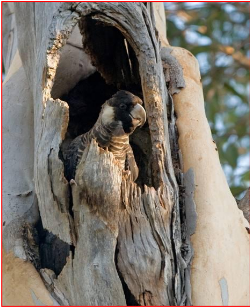
雌性鲍丁凤头鹦鹉在巢中