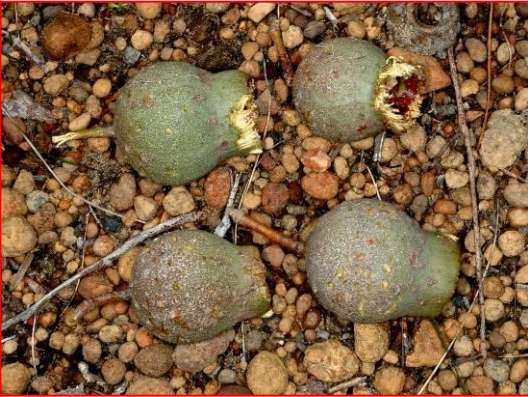
جوز المرّي ممضوغا من قبل كوكاتو بودن