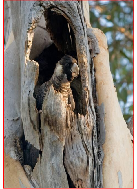
أنثى كوكاتو بودن في العش

الترجمة: خلود طوطج تصميم التنسيق: كيم سارتي